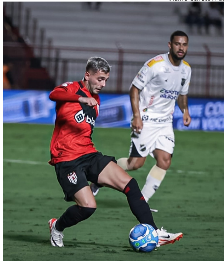
Após vitória ontem no Estádio Antônio Accioly, Atlético terá pela frente confrontos diretos na luta para voltar à elite do Brasileiro