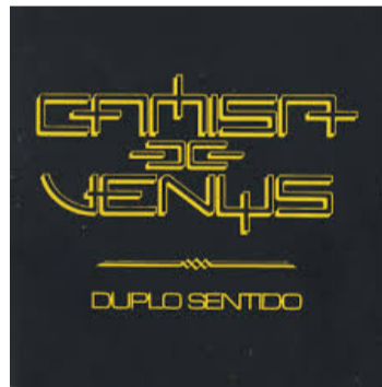
Duplo Sentido' saiu em 87