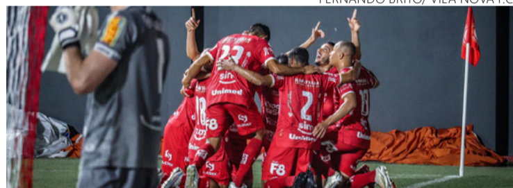
Vila Nova: vitória até 42 minutos do segundo tempo. Depois: derrota