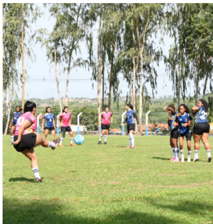
Competição terá jogos nos estádios Olímpico e Serra Dourada entre os dias 20 e 22 de outubro

O Governo de Goiás oferece todo o suporte de logística e transporte para as equipes, além do material esportivo, com jogos de uniformes completos, hospedagem e alimentação durante todos os finais de semana de disputas.