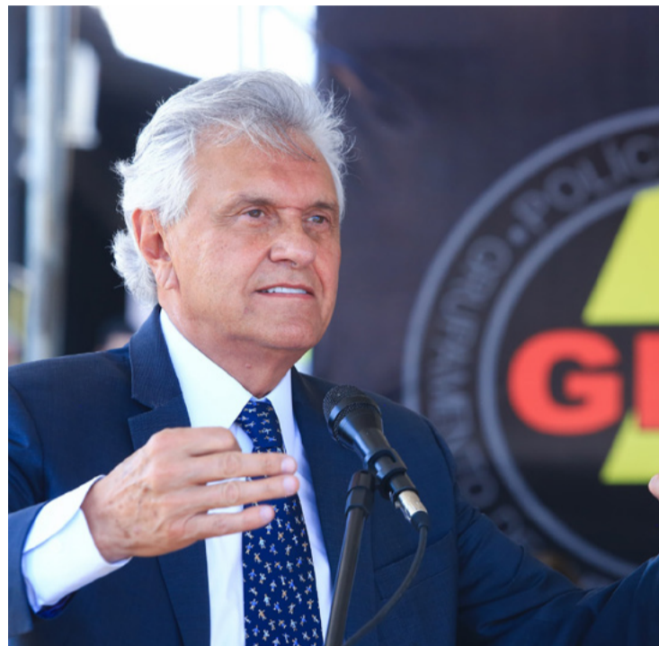
Ronaldo Caiado participa de entrega de equipamentos para o Grupamento de Intervenção Rápida Ostensiva (Giro)

Ao falar para os integrantes do Giro, Daniel Vilela disse que a segurança tem sido “um dos grandes legados que o governador Ronaldo Caiado está deixando para Goiás” e que o grupamento é um dos responsáveis pela redução na criminalidade.