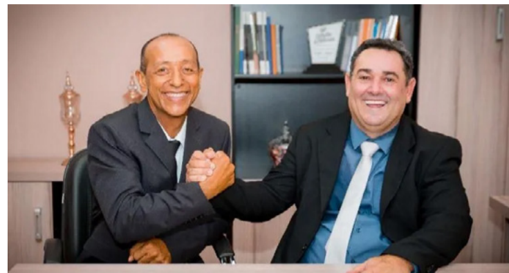
Manancial do Rio dos Bois, em Campos Verdes: TJGO mantém decisão contra mineradora