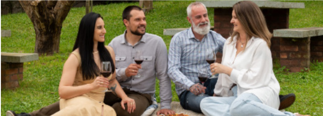
É impossível: vontade é parar aqui, segurar a taça com vinho, esquecer o mundo

Coluna Prazeres à Mesa sai neste espaço às sextas-feiras