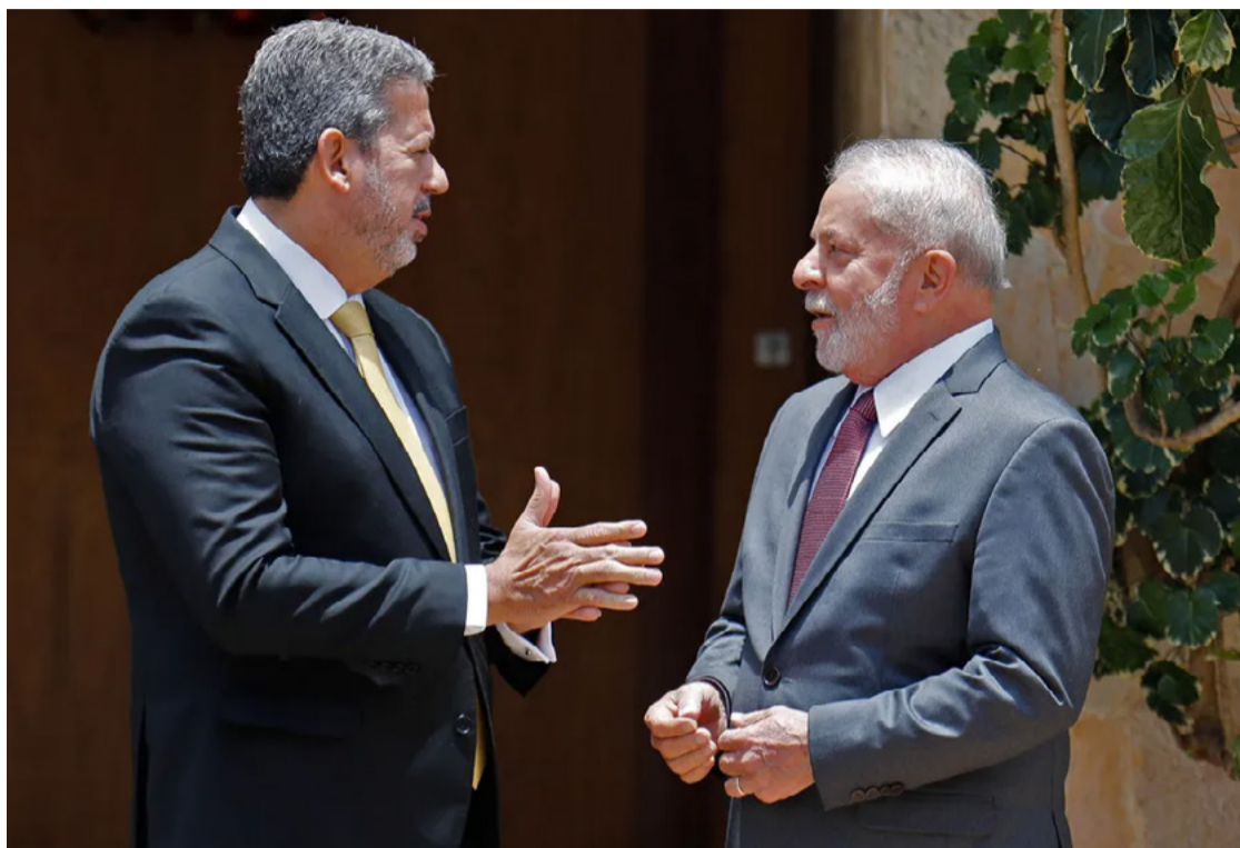
Arthur Lira (PP/AL) e Lula da Silva (PT): governo de coalização, troca de cargos e disputa pelo poder

O “novo” Pacheco - que emergiu depois da decisão do