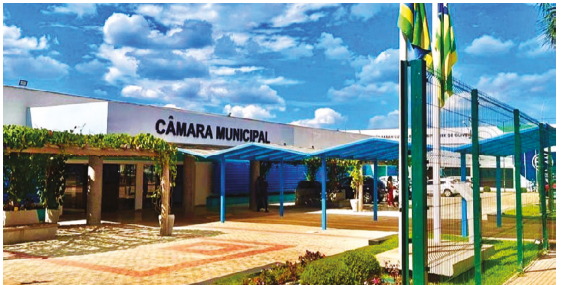
Câmara Mun. de SAD

Para saber mais informações sobre o Concurso Público da Câmara Municipal e tudo que acontece no Legislativo, os interessados podem acessar os canais oficiais, ou pelo site da Casa ( https://camarasad.go.gov.br/ ).