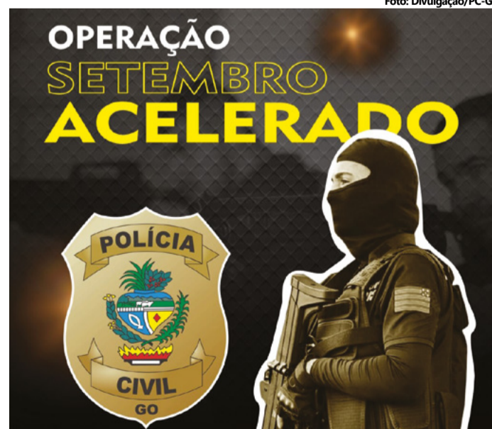
As ações realizadas pela 11ª Delegacia Regional de Polícia também contribuíram para a pacificação