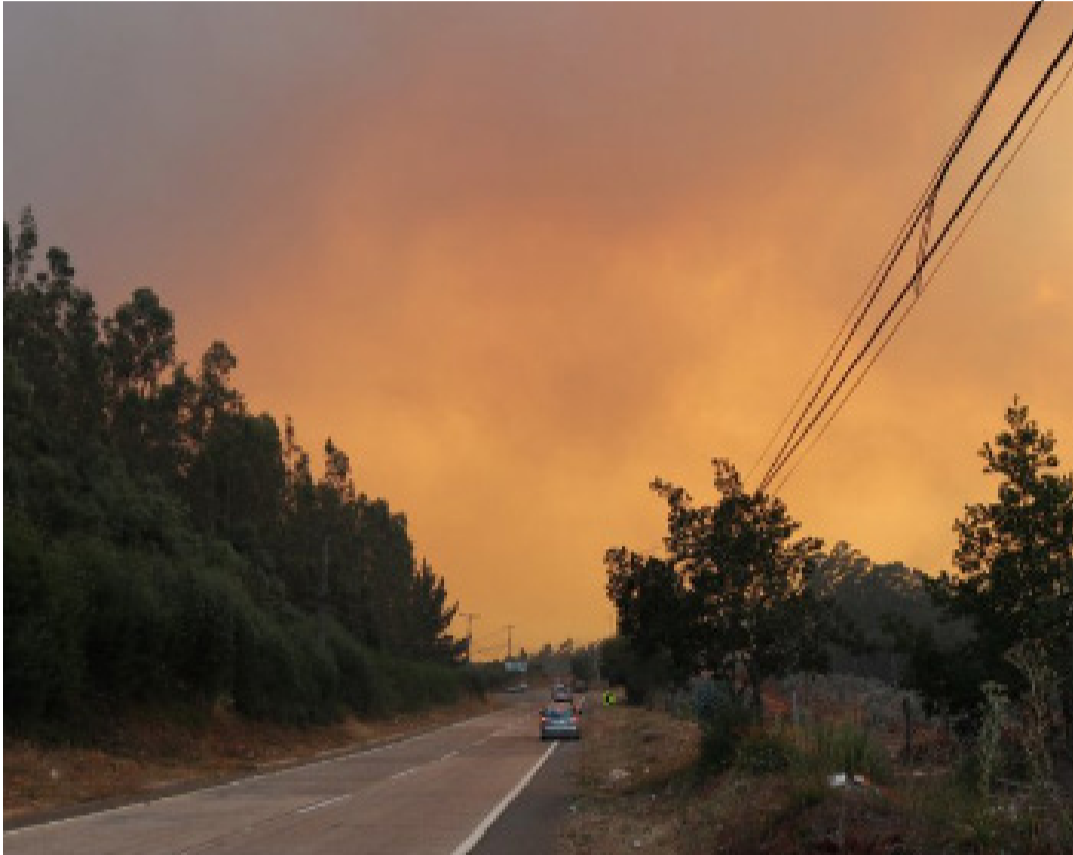
Paz: mundo arde em chamas por conta de conflito armado

Há pensamentos que só se escuta dentro de uma taça de vinho. Por alguns segundos olhando aquela taça, me vi pensando sobre o que está acontecendo com o mundo e o nosso país. Navegando neste imenso oceano. A vontade é parar aqui, segurar a taça com vinho, esquecer o mundo. Mas é impossível! Senti uma tristeza fluindo em mim, na sutileza do cheiro da inércia, da minha taça de vinho. Não poder fazer nada em prol daqueles rostos inocentes sendo destruídos pela guerra.