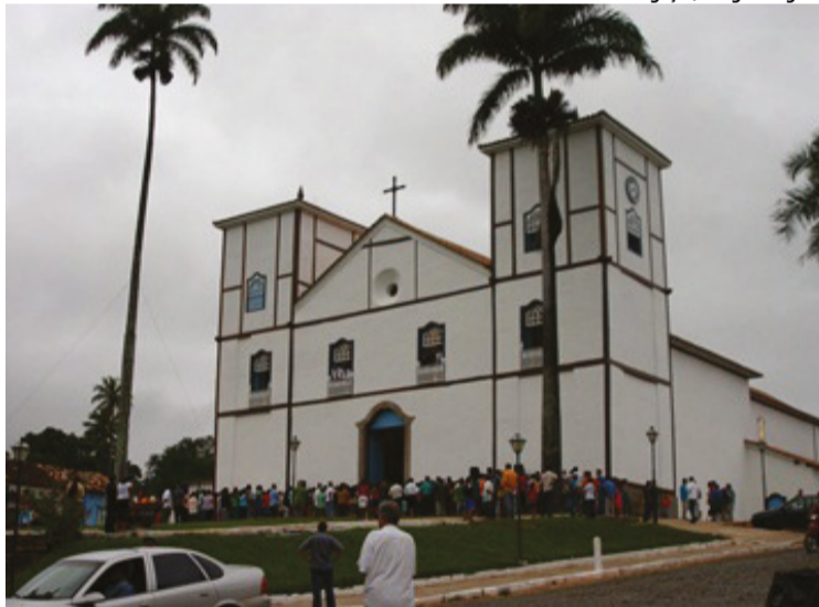
Igreja Matriz de Nossa Senhora do Rosário.

Pirenópolis, um dos principais pontos turísticos de Goiás, é famosa por sua cultura, história, gastronomia e belezas naturais. De acordo com a Secretaria de Turismo, a cidade recebe cerca de 80 mil turistas por mês. Segundo o último censo do Instituto Brasileiro de Geografia e Estatística (IBGE), o município possui cerca de 26 mil habitantes, um número quase equivalente à quantidade de turistas que a cidade recebe durante os finais de semana.