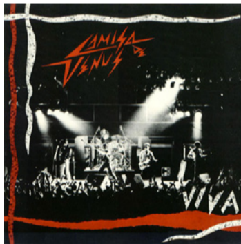
Capa do elepê 'Viva', de 86