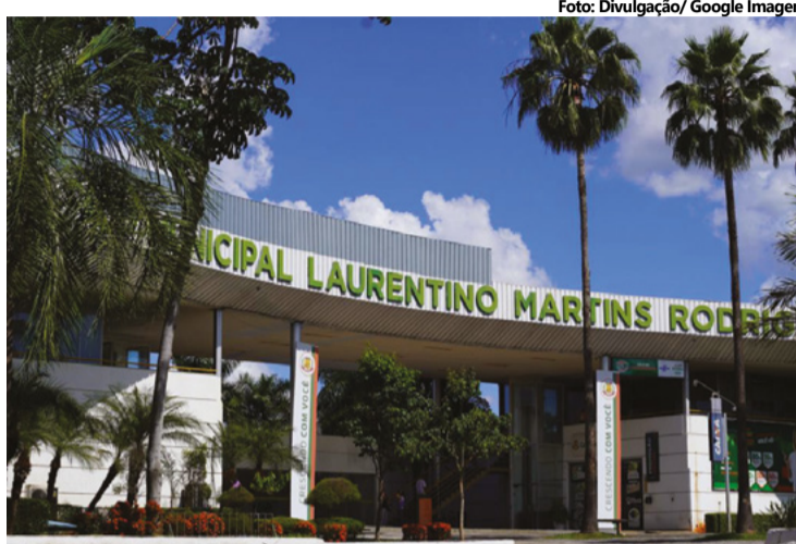
Prefeitura de Goianésia